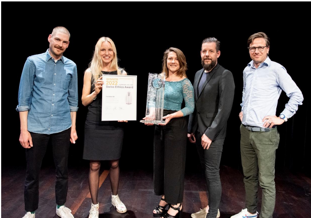
Tide Ocean SA – Winner Swiss Ethics Award 2022

Verantwortung für eine nachhaltige Zukunft übernehmen