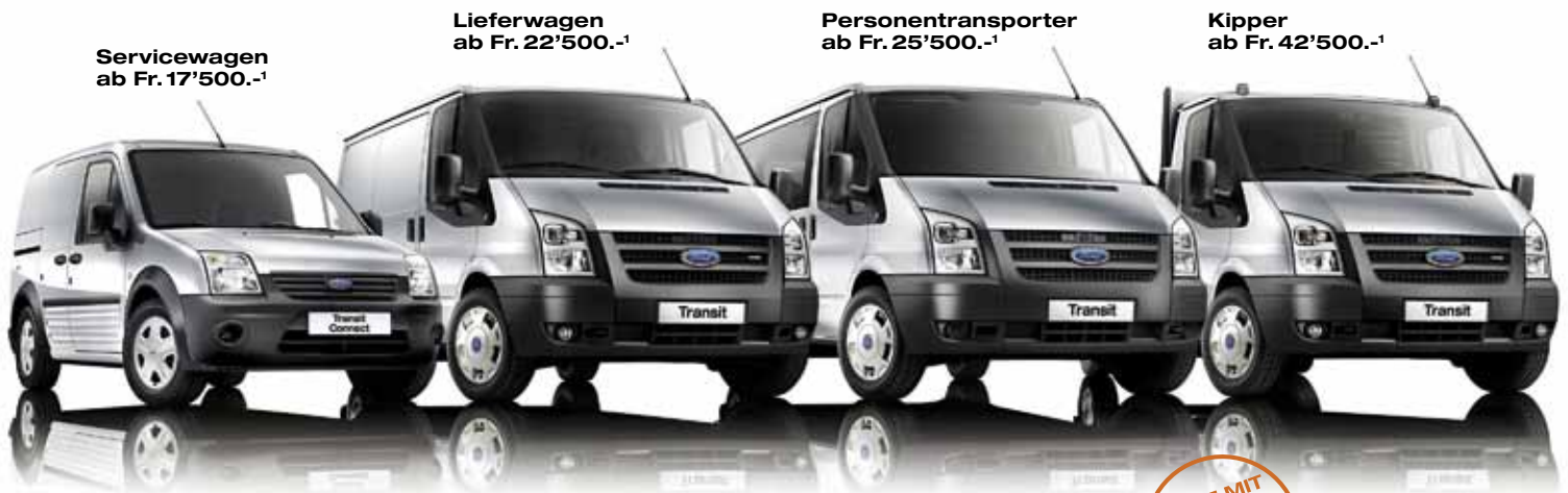
Servicewagen ab Fr. 17'500.- 1

1 Nettopreise für gewerbliche Kunden mit Handelsregistereintrag. Angebot gültig bis 31.12.2009 bei teilnehmenden Händlern. 2 Ford Credit Tiefzinsleasing kumulierbar mit sonstigen Prämien (ausser beim Ford Transit Connect). 3 Gemäss europäischen Immatrikulationszahlen, Stand April 2009, Segment 1+2t Fahrzeuge.